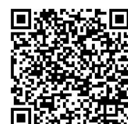
はっちホームページ